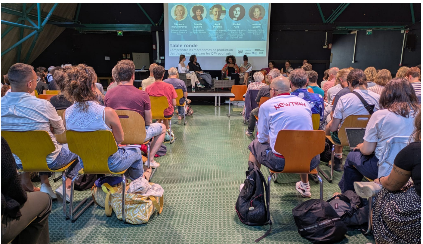
Journée «Lutte contre les discrimination» à Rennes en juillet 2025