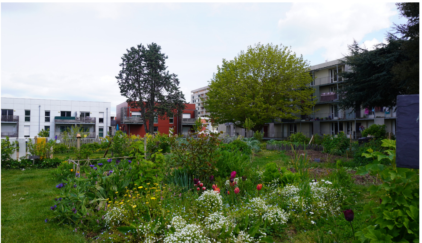
Quartier Europe à Saint-Brieuc