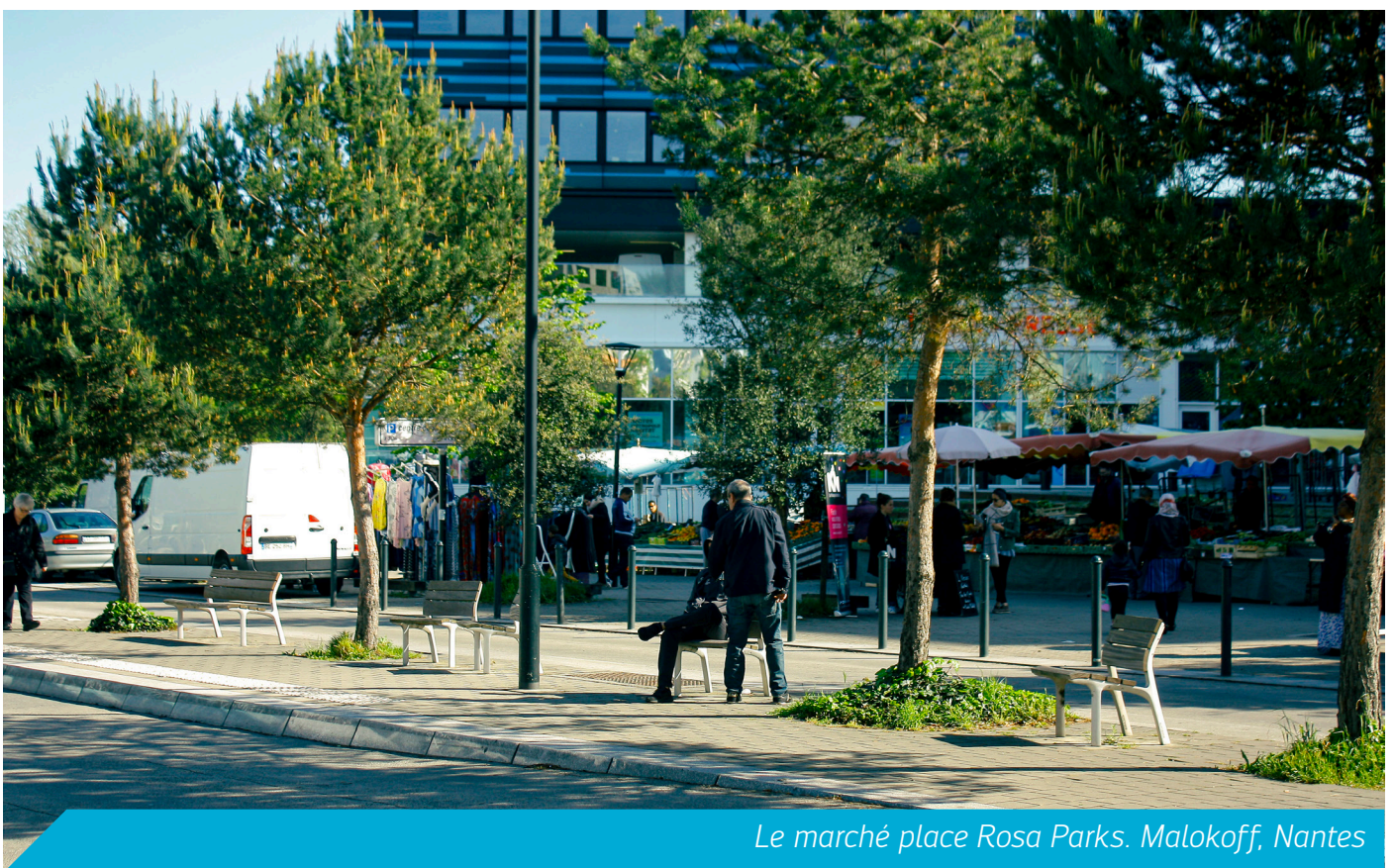
Le marché place Rosa Parks. Malokoff, Nantes

→ Déployer un plan "Emploi et lutte contre les discriminations" afin d'accompagner les entreprises dans leurs pratiques de recrutement vers des pratiques plus inclusives et lutter contre les stéréotypes