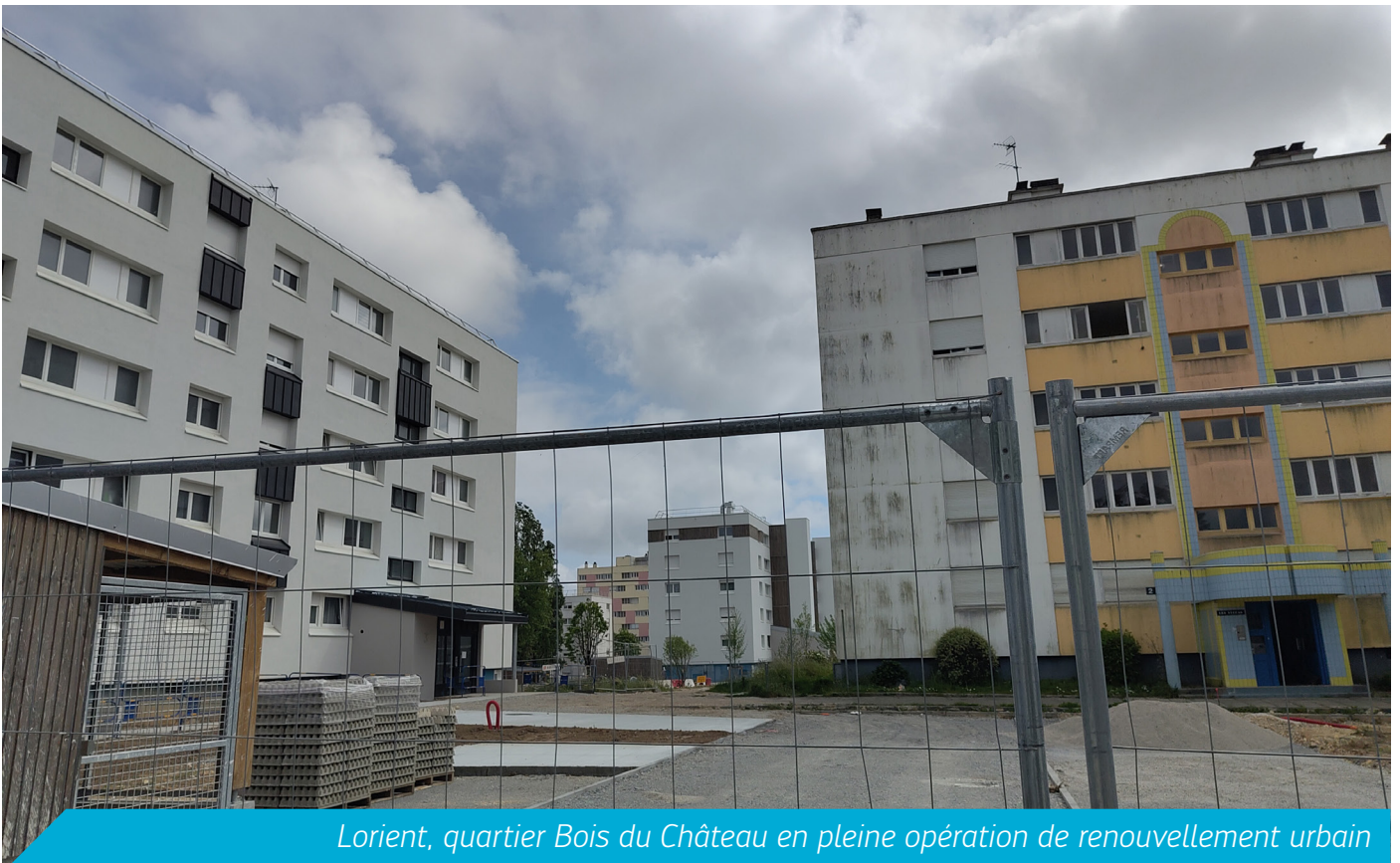
Lorient, quartier Bois du Château en pleine opération de renouvellement urbain